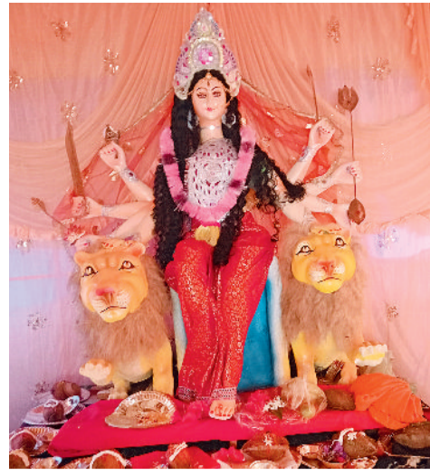
पंचायत चौक ग्राम कोसमंदा मे विराजी मां दुर्गा दो शेर वाला।