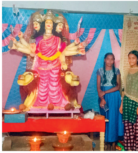
दहान पारा धरिघोल।