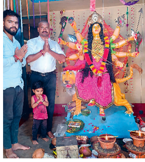
श्री राम चौक ग्राम छडीया मे विराजी मां दुर्गा।