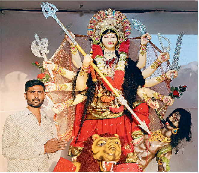
जय मां महामाया दुर्गात्सव -पोराभौंटा