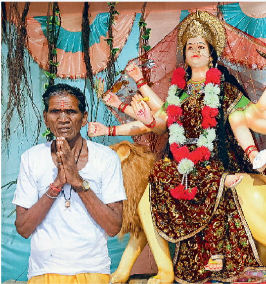
मां महामाई दुर्गात्सव -बस्ती पारा