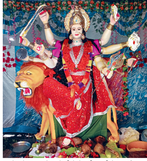
महादेव चौक ग्राम सोनार देवरी मे शेर की सवारी मे मां दुर्गा।