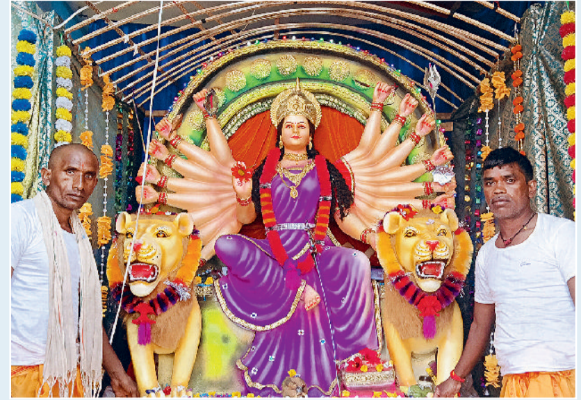
ओम शांति दुर्गात्सव-गोवर्धन चौक