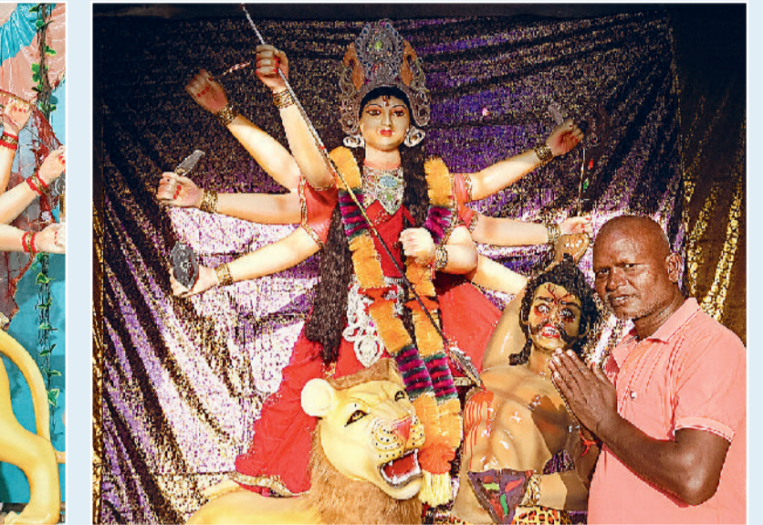
मां जगदंबे दुर्गात्सव - बजरंग चौक