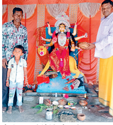
नीम चौक ग्राम बांसबिनीरी मे विराजी मां दुर्गा।