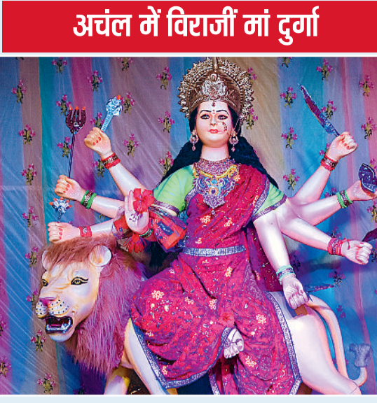
ऊं शांति दुर्गात्सव -केशर खदान पारा