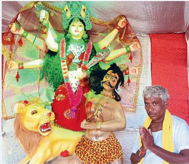
जय मां चण्डी दुर्गात्सव-बाजार चौक